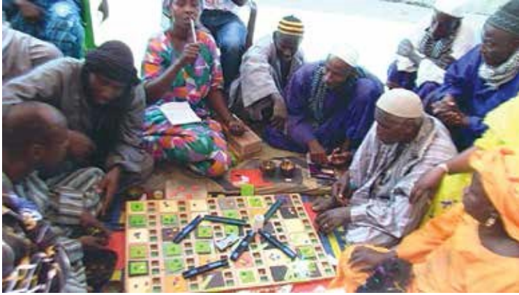
Illustration 2. La plateforme est conçue de façon à permettre des simulations prospectives complexes à partir d'éléments de modélisation simples, appropriables par tous.

À la fin des années 2000, le support de simulation est amélioré de façon à pouvoir être utilisé à grande échelle dans de multiples localités d'un pays, permettant ainsi une utilisation nationale pour l'élaboration concertée de politiques publiques (réformes foncières, codes règlementaires environnementaux, organisation de filières...).